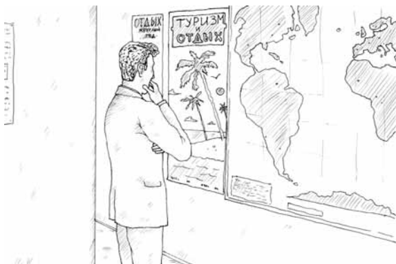
Избегайте поездок в небезопасные страны

При подготовке поездки особое внимание надо уделить истории, религиозным обрядам и географии вашего пунк-