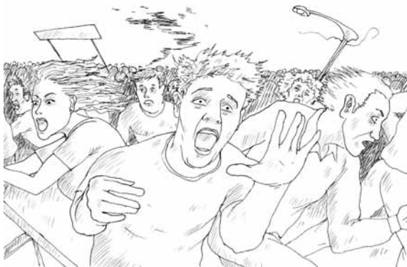
Бегущая толпа не менее опасна, чем взрыв гранаты