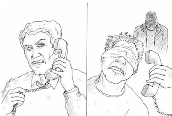
Для террориста жизнь заложника — вопрос второстепенный

В случае если вы узнали о захвате близкого человека, немедленно звоните в милицию. К освобождению заложников подходят очень серьезно, привлекая профессионалов из МВД и ФСБ с их уникальными техническими средствами. Предварительная подготовка к операции длится от нескольких часов до нескольких дней. Это зависит от той скорости, с какой бандиты выдвигают свои требования, и от родственников жертвы — насколько быстро они обратятся в милицию и как поведут себя в дальнейшем. Дело осложняется, если родственники самостоятельно пытаются откупиться от бандитов или ведут «двойную игру».