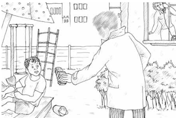
Посторонний рядом с ребенком всегда подозрителен

Собирая ребенка гулять, не надевайте на него дорогих украшений, которые могут стать причиной нападения. Если вы все же отпустили ребенка гулять одного, присматривайте за ним из окна. Заметив, что к ребенку подошел незнакомый человек, позовите его домой или тут же спуститесь к нему сами. Оставляя ребенка на улице, договоритесь с кем-то из соседей, гуляющих с детьми, присмотреть за ним. Используйте места для игр, удаленные от шоссе, или специально оборудованные площадки. Отпуская ребенка одного, предупредите его о наиболее опасных местах, в частности, о том, что нельзя заходить в подвал, на чердак, прятаться под машинами. Обязательно расскажите ребенку о правилах безопасности, если он любит кататься на велосипеде или роликовых коньках. Также предостерегите своих детей относительно общения с домашними животными. Пусть они запомнят – играть с чужими животными нельзя.