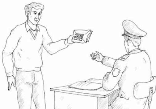
Записанная угроза — почти улика

Кроме угроз, выдвигаемых по телефону лично вам, преступники могут использовать ваш номер телефона для сообщения информации, которую вы должны будете пере-