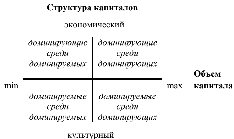
Рис. 6. Модель социального пространства

Внутри социального пространства формируются особые сферы практик – поля, каждое из которых является автономной по отношению к другим полям ареной борьбы за ресурсы и символическое признание. Автономность обусловлена тем, что успех – занятие доминирующей позиции в данном поле, экономическом, политическом, академическом и т. п., зависит от обладания специфическим капиталом . Наряду с экономическим капиталом (собственность, деньги), Бурдьё выделяет культурный (образование, воспитание) и социальный (происхождение, связи) капиталы.