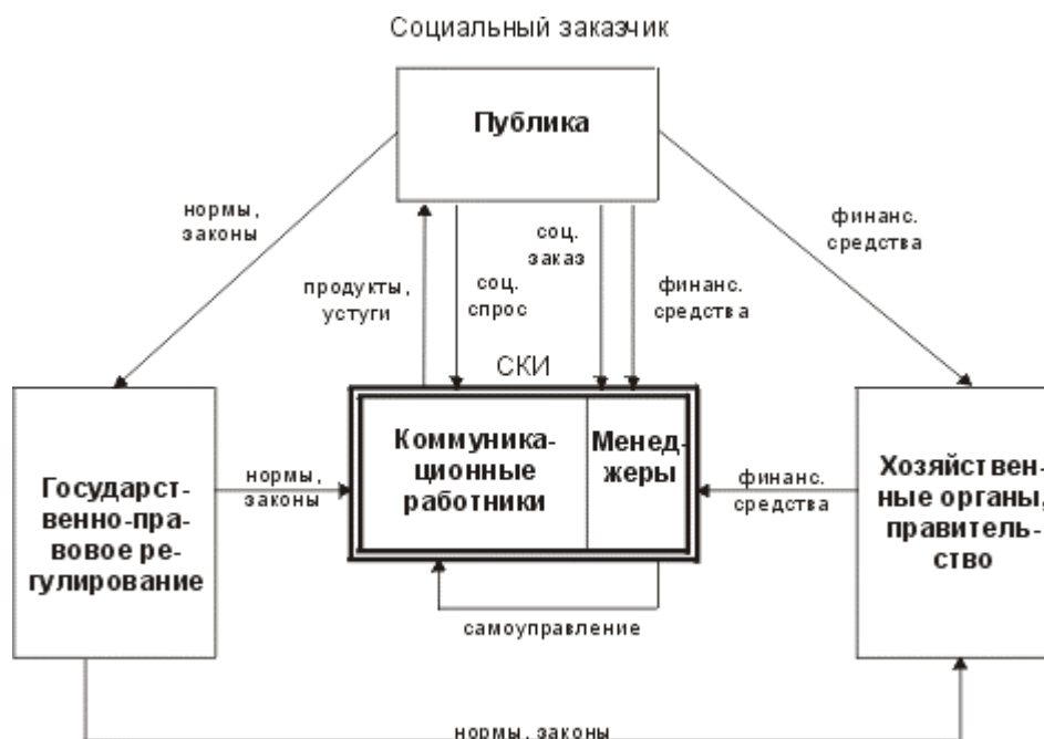
Рис.9.2 Схема либерально-демократической индустриальной ОКС