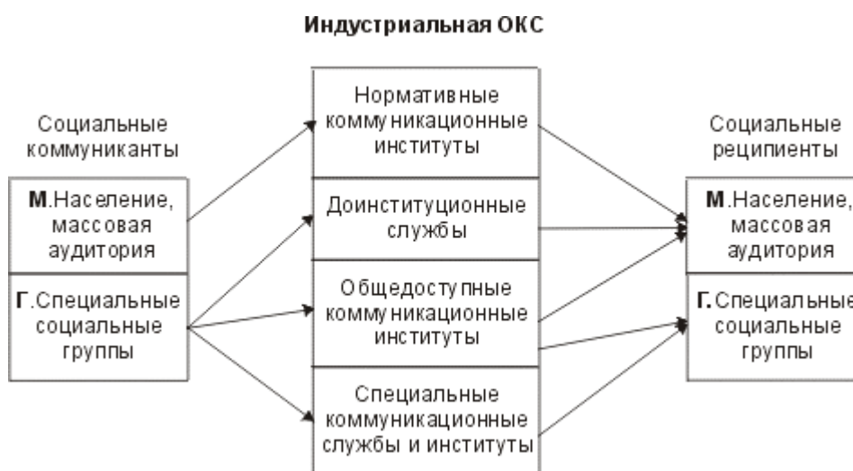
Рис.9.1 Социальные коммуниканты и реципиенты индустриальной ОКС

В качестве социальных коммуникантов и реципиентов индустриальной ОКС выступают: население, массовая аудитория (М) и специальные социальные группы (Г). При посредничестве ОКС происходит диалог М д М и Г д Г, а также управление Г у М, соответствующие миди- и макрокоммуникации (см. рис. 2.2.). Взаимодействие индустриальной ОКС со своими коммуникантами и реципиентами наглядно представлено на рис. 9.1.