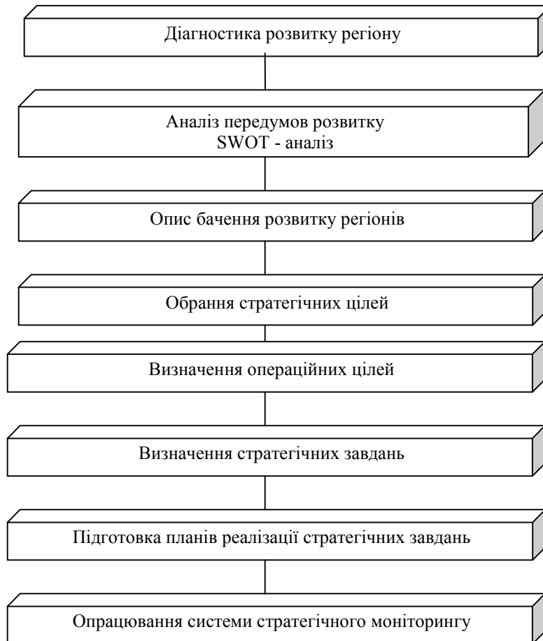
Рис. 1. Детальні етапи стратегічного планування

Більш детальні етапи стратегічного планування наведені нижче (рис. 1).