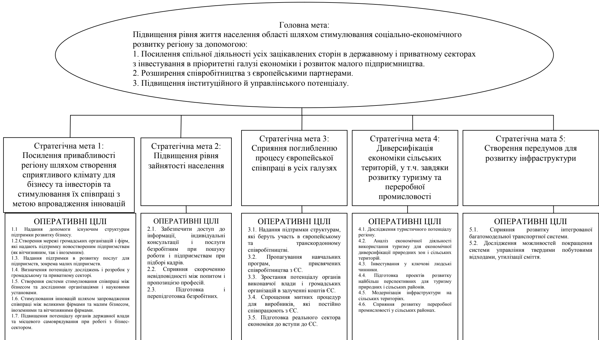
Рис. 4. Фрагмент цілей Стратегії економічного і соціального розвитку Волинської області на 2004–2015 рр.